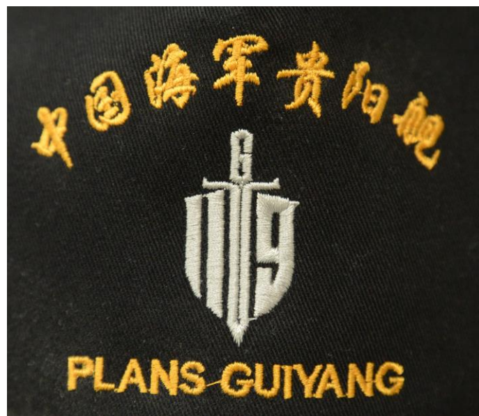
Abbildung 1: „Schwert und Schild der Partei“ — Internes Verbandsabzeichen des Lenkwaffenzerstörers DDG-119 GUIYANG der Marine der Volksbefreiungsarmee (PLANS = People’s Liberation Army Navy Ship) auf einer Bordmütze

Das Selbstverständnis der VBA als Armee der Partei drückt sich auch in der verwendeten Symbolik aus, wie sie sich beispielsweise auf einem internen Verbandsabzeichen darstellt (siehe Abbildung 1).